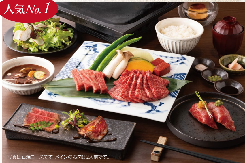
写真は石焼コースです。メインのお肉は2人前です。